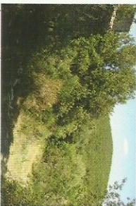
Alemons de Roquessels