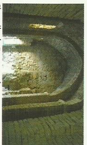
Chapelle de Roquessels